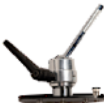
ACCROCHE 360° STANDARD