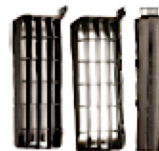
DOP CHOICE SNAPGRID